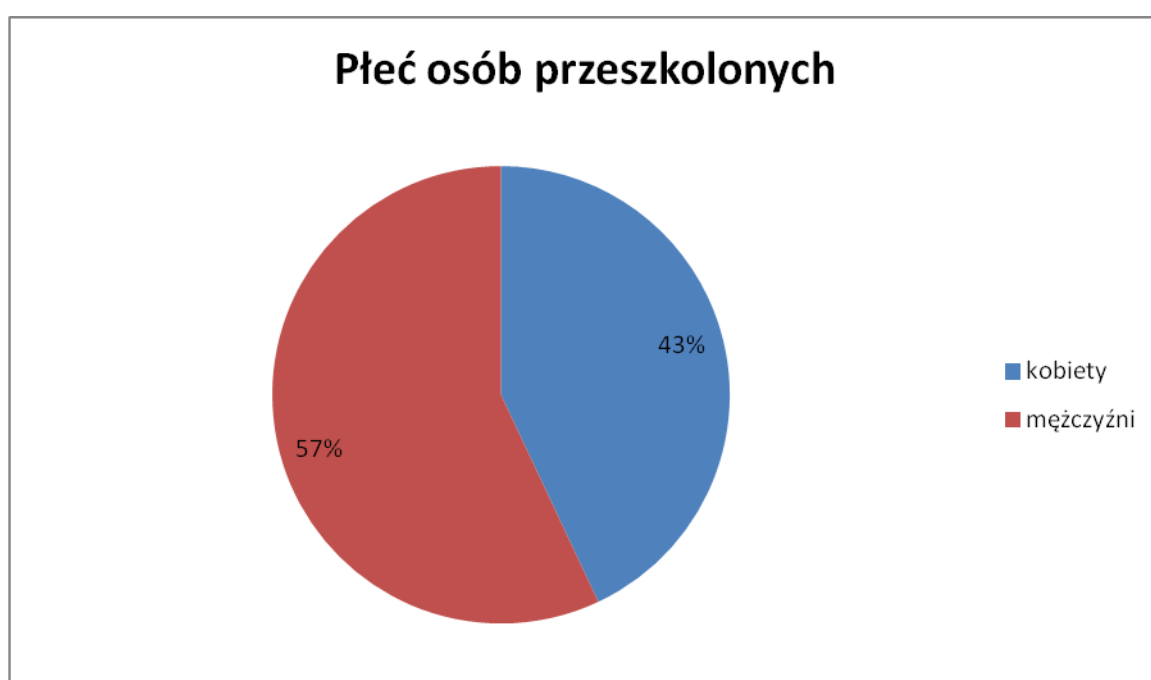
Wykres nr 5. Osoby przeszkolone według kryterium płci.