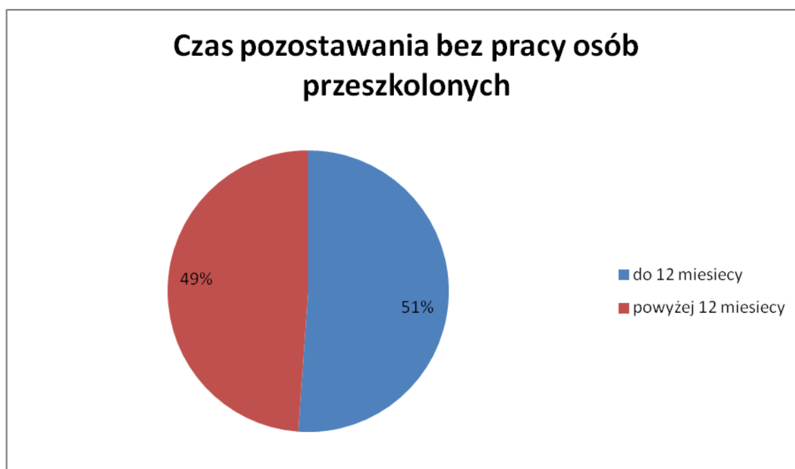
Wykres nr 4. Osoby przeszkolone według czasu pozostawania bez pracy.