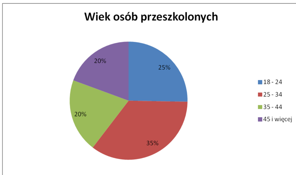
Wykres nr 2. Osoby przeszkolone według wieku.