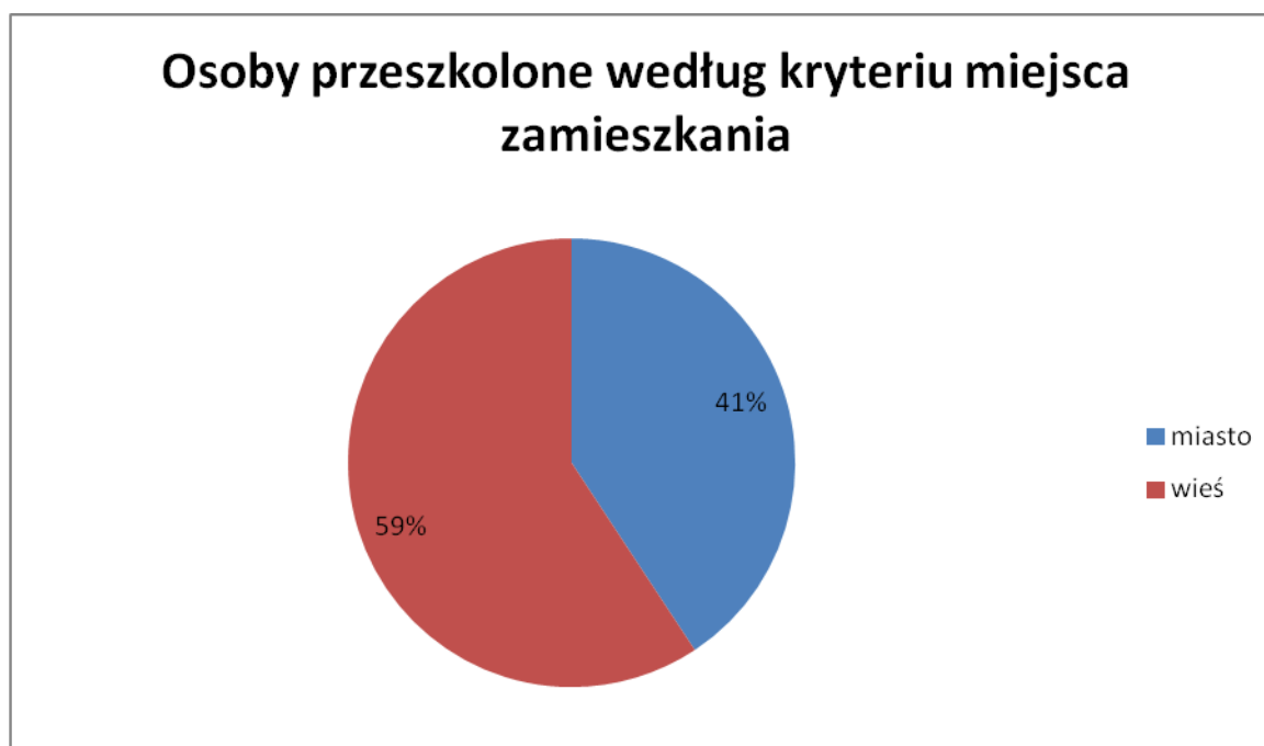
Wykres nr 5. Osoby przeszkolone według kryterium miejsca zamieszkania.