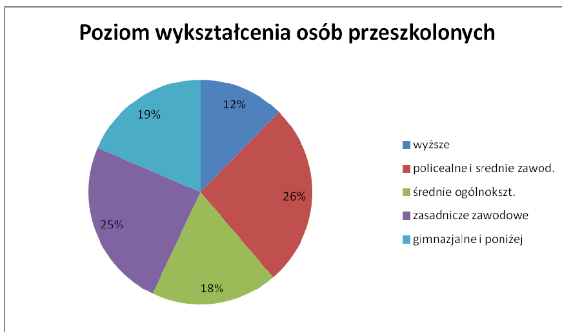
Wykres nr 3. Osoby przeszkolone według poziomu wykształcenia.